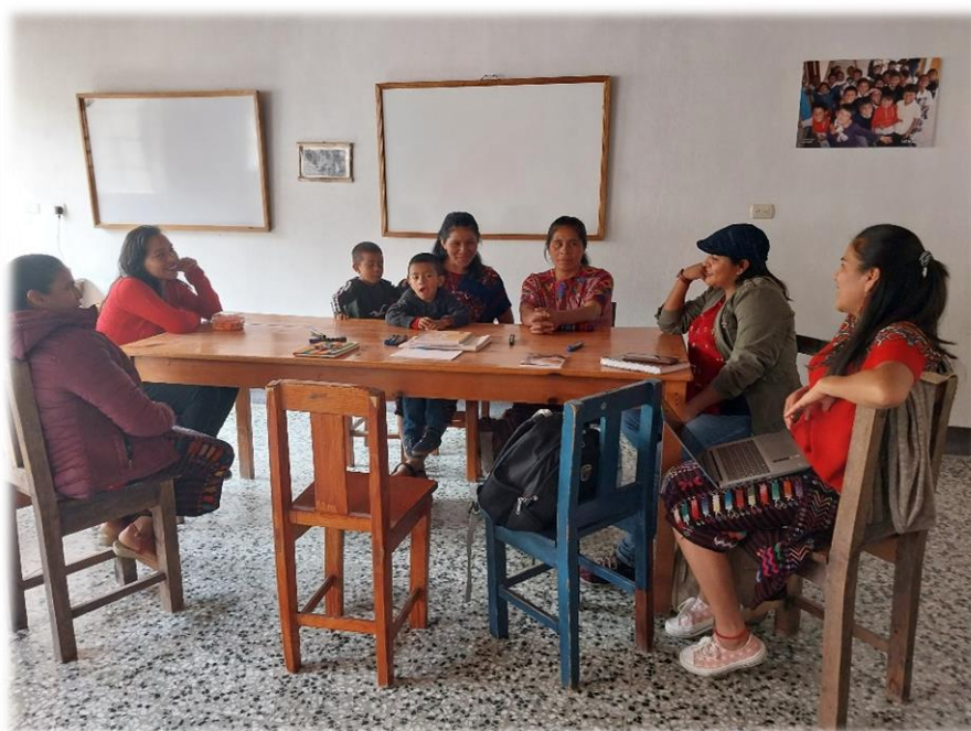
Grupo Focal con Mujeres Mam, Huehuetenango, Guatemala. Mayo, 2023