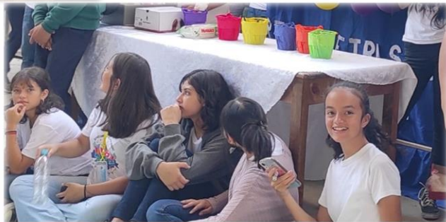
Memoria fotográfica -Trabajo con NNA, apoyado por CDM en Marcala - La Paz, Honduras