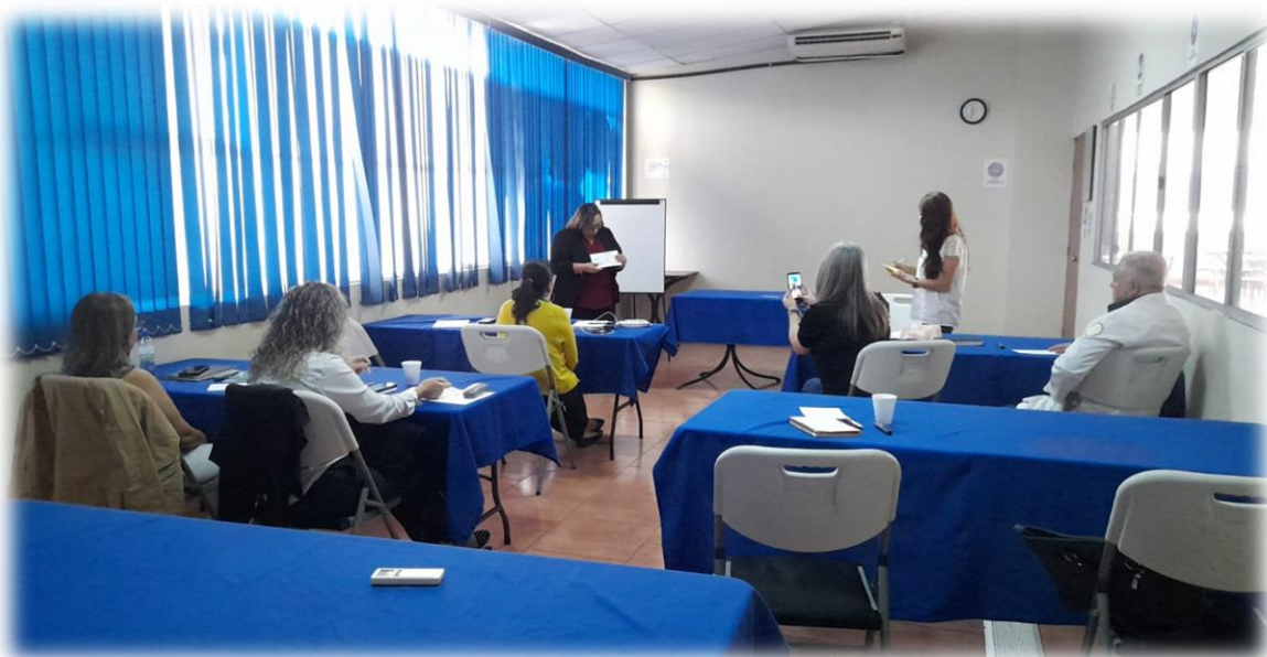
Participantes del Grupo focal con funcionarias/o del Instituto de Medicina Legal y CSJ Órgano Judicial de El Salvador. Mayo, 2023