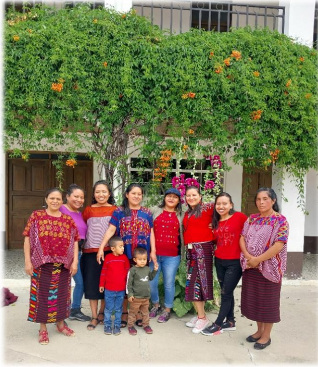
Equipo territorial de Actoras de Cambio y Mujeres Mam, Huehuetenango, Guatemala. Mayo, 2023